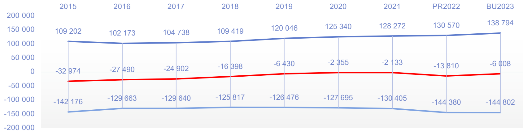
Utveckling av intäkter och förbundets kostnader 2015-2023

PR2022 - Exkl. KI Främjandemedel 5,7 Mkr 2022