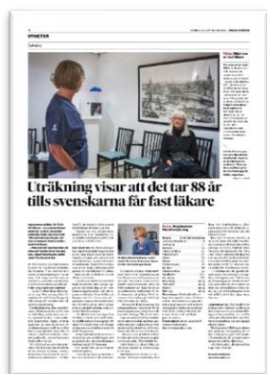
Bild: Artikel ur tidningen om kompetensförsörjningen i Sverige

Baserat på enkäten publicerade DLF en rapport där det framgår att med dagens rekryteringstakt kommer den genomsnittliga regionen att få full bemanning först om 88 år (!) och vissa regioner aldrig. Endast en region (Jämtland-Härjedalen) kommer att nå riktvärdet inom 10 år. https://slf.se/dlf/app/uploads/2024/09/Rapport-bemanningsenkaten.pdf .