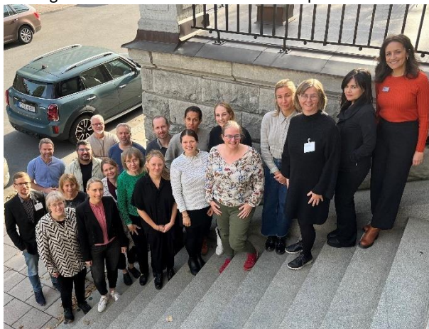
Bild: Höstmötet från 2024.