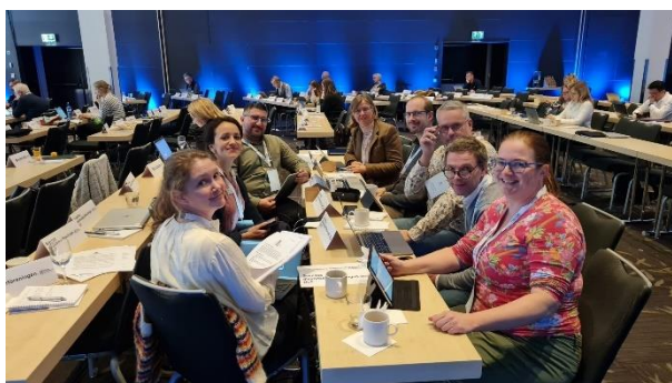
Bild: Styrelsen på Sveriges Läkarförbundets fullmäktige.