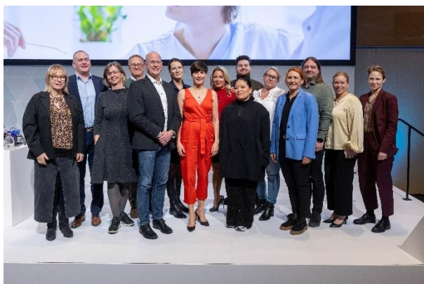
Bild: Förbundsstyrelsen 2024.