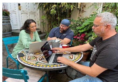
Bild: En del av styrelsen under internatet.

Under internatet besöktes DLF:s danska motsvarighet Praktiserende Lægers organisation (PLO) samt gjordes ett studiebesök på en läkarmottagning strax utanför Köpenhamn. Besöken gav god insikt i hur en specialist i allmänmedicin arbetar i Danmark. Den goda kontinuiteten imponerade medan ersättningsystemet avskräckte.