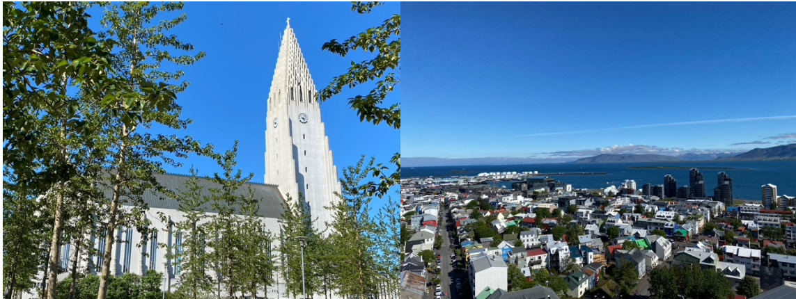
Hallgrim kyrka och utsikten över Reykjavik

Island visade sig från sin vackraste sida under konferensen och vädret var varmt och soligt som enligt de isländska kollegorna som deltog i kongressen är ganska ovanligt även under sommarmånaderna. Därför var det extra roligt att kunna använda de lediga stunderna till att upptäcka lite av Reykjaviks centrum där jag bland annat kunde njuta av utsikten över staden från tornet av Hallgrims kyrka.