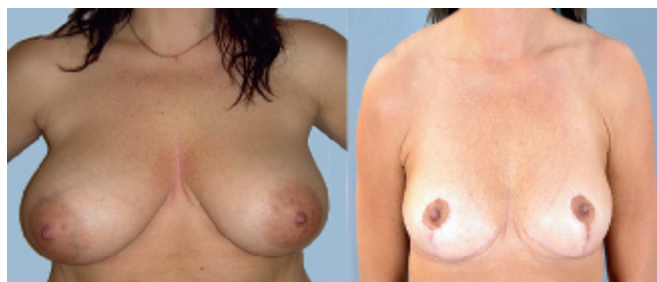
35-årig kvinna med bilateral brösthypertrofi. Hon behandlades med bilateral reduktionsplastik.