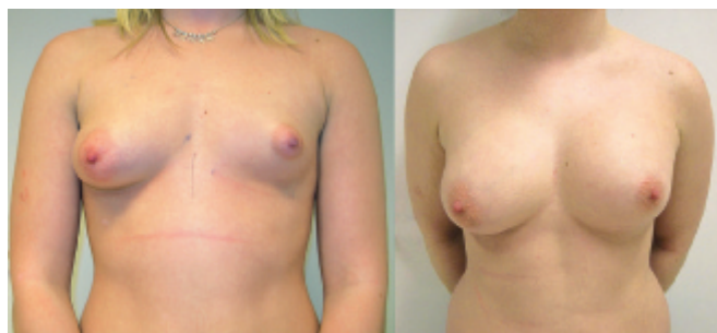
20-årig kvinna med bröstasymmetri. Kvinnan behandlades med högersidig reduktionsplastik och vänstersidig augmentation med protes.