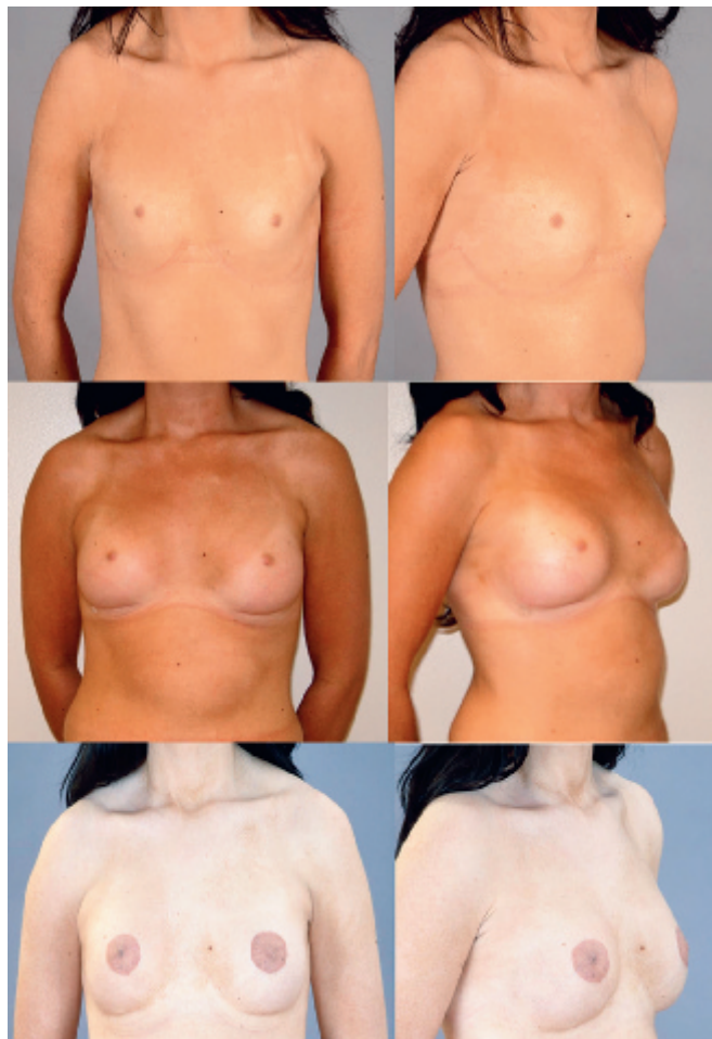
20-årig kvinna med bilateral bröst- och areolahypoplasi. Kvinnan behandlades med augmentation med protes och areolatatuering.

För att få effekt på besvären bör en volym på 400 ml efter reduktionen eftersträvas, och volymen borttagen vävnad får inte understiga 400 ml på största sidan. Före operationen ska adekvat brösttanarnas ha tagits och klinisk undersökning av bröst och regionala lymfkörtlar genomförts. Patienter som är 40 år eller äldre ska dessutom genomgå mammografiundersökning preoperativt. Undersökningen får vara högst sex må-