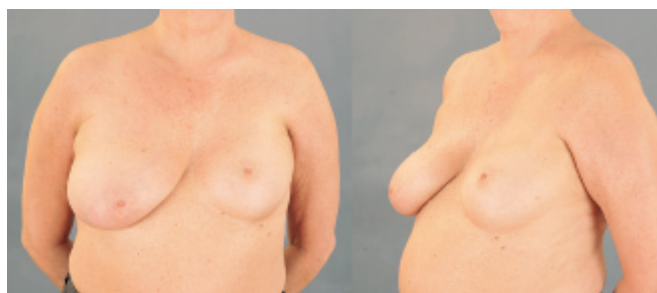
60-årig kvinna med vänstersidigt Polands syndrom. Kvinnan behandlades med högersidig reduktionsplastik. Båda bilderna tagna preoperativt.