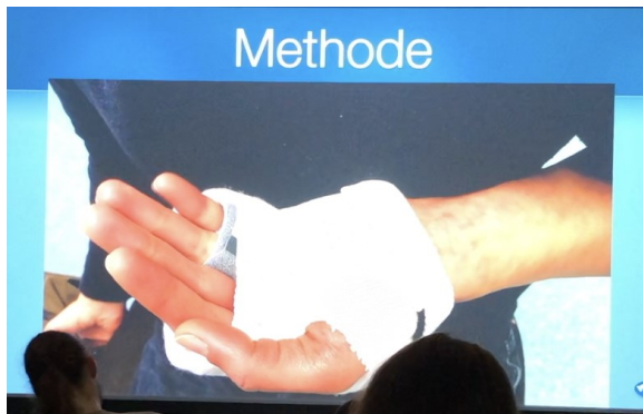
Icke-kirurgisk behandling av grundfalngfraktur