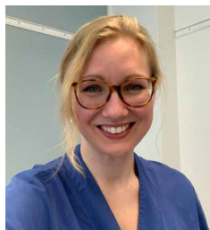
Ledamot, ordinarie val för perioden 2023-2025