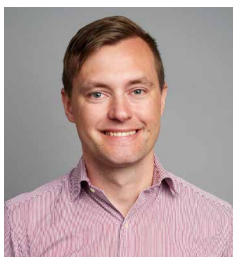
Förste vice ordförande, fyllnadsval för perioden 2023- 2024

Nominerad av SYLF Dalarna, SYLF Västernorrland, SYLF Jämtland, SYLF Örebro och SYLF Norrbotten med följande motivering: