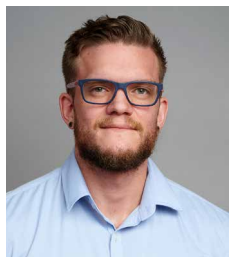
Förste vice ordförande, fyllnadsval för perioden 2023- 2024

För att se kandidatpresentation och fackligt CV