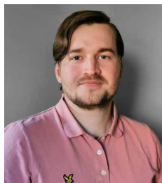
Ledamot, ordinarie val för perioden 2023-2025

För att se kandidatpresentation och fackligt CV