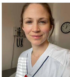
Andre vice ordförande, ordinarie val för perioden 2023-2025