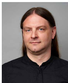
Ordförande, ordinarie val för perioden 2023-2025