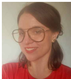
Ledamot, fyllnadsval för perioden 2023- 2024

För att se kandidatpresentation och fackligt CV